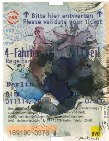
Peer Kriesel: „Fahrt 0376“, 2015