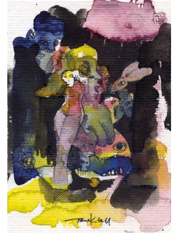
Peer Kriesel: „Alice im Untergrund“, 2011

Zur Präsentation der neuen Kollektion in New York verlost der Künstler eine Edition seiner „Fahrt 0376“ als gerahmten und signierten Print.