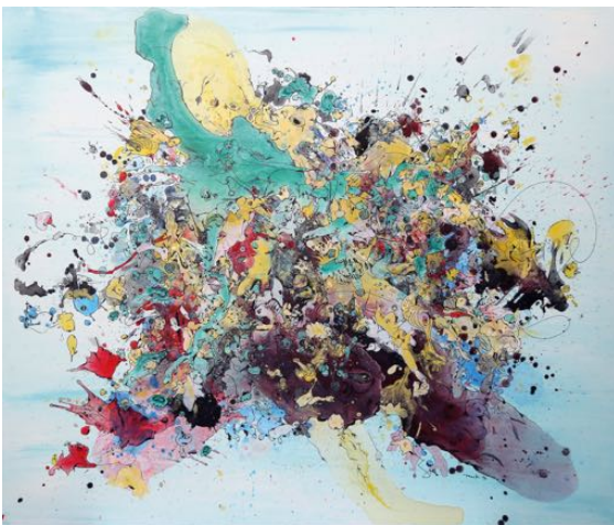
Peer Kriesel: „Gezwitscher“, 2013, Acryl/Edding auf Leinwand, 135 x 160 cm

Galerie am Jägertor, Lindenstraße 64, Potsdam (ab 22.3.2013)