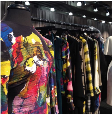
Bass-Collection mit Kriesel-Motiv, © Ryan Michael Kelly

+++++++ mit Verlosung von handsignierten Print von Peer Kriesel+++++++